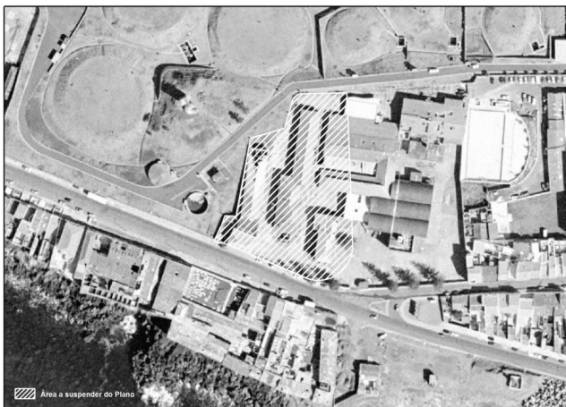
Extrato de ortofotomapa Suspensão parcial do Plano Diretor Municipal de Ponta Delgada