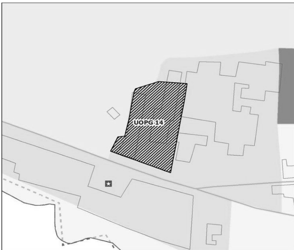
Extrato da Planta de Ordenamento Plano Diretor Municipal de Ponta Delgada