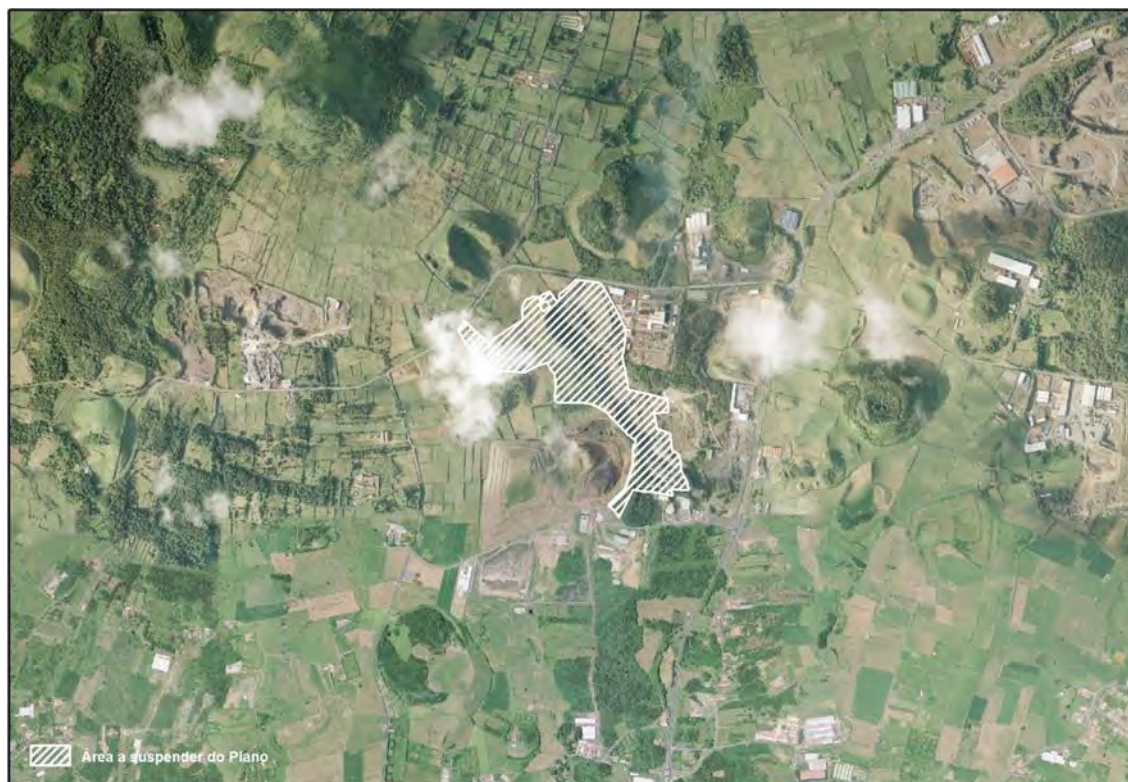
Extracto de ortofotomapa Suspensão parcial do Plano Director Municipal de Ponta Delgada

Extracto de Ortofotomapa com a delimitação da área respeitante à suspensão parcial